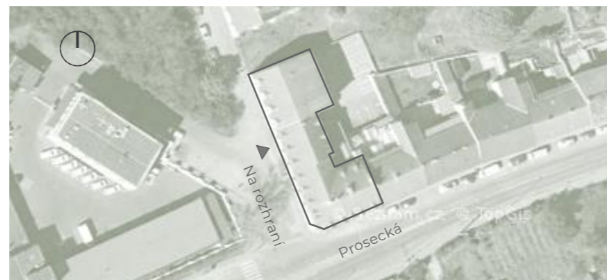
Lokalita - Prosecká 73/69

Prosecká vyhlídka je umístěna v nižší zástavbě navazující na starý Prosek nad Vysočanami a nad Libní. Atmosféru místa dotváří krásné výhledy na vinice a panorama Prahy a množství zeleně v okolí. Přímo za domem začíná lesopark Prosecké skály, nedaleko se nachází také oblíbená Prosecká vyhlídka, bobová dráha nebo Park přátelství o rozloze 11 hektarů.